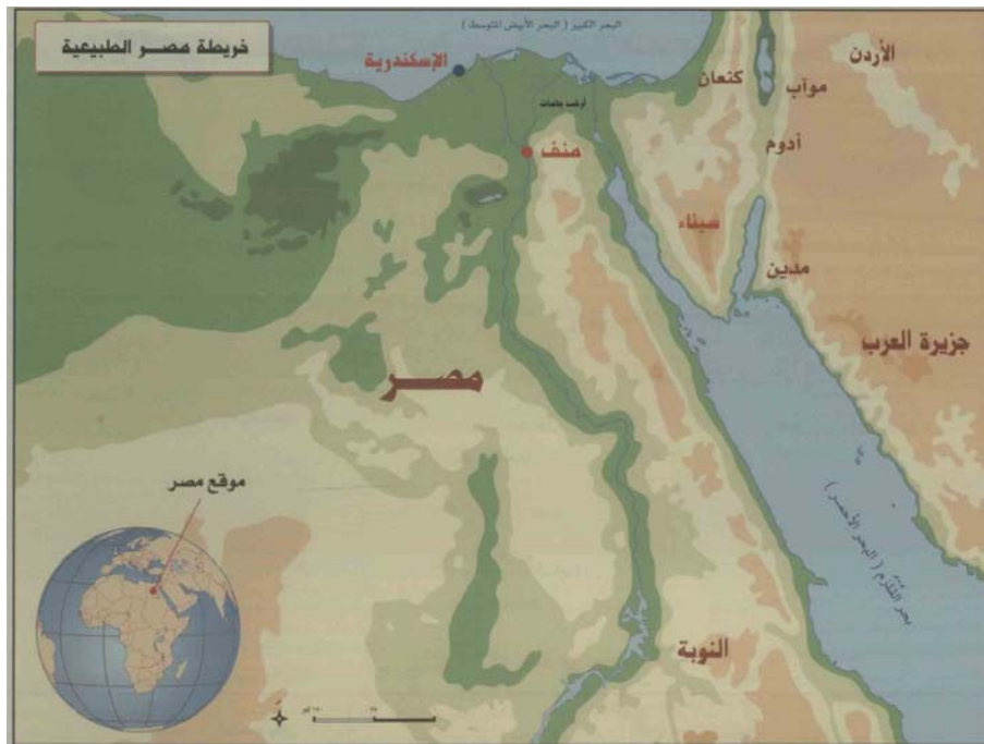
ارض جاسان (بلیس قدیم) در شمال منف و جنوب شرقی اسکندریه (دوره باستانی) (مغلوث، ۶۲).

داخلی و خارجی و قرار گرفتن در محاصره‌های طولانی لشکریان مهاجم، نتوانسته است از رشد علمی و فرهنگی قابل‌ملاحظه‌ای برخوردار گردد و با وجود اینکه در نزدیکی شهر بزرگی چون قاهره واقع شده بوده، از پیشرفت‌های علمی و فرهنگی آن روزگار باز مانده است. در اوایل سده نوزدهم نیز با انتقال و جابجایی مرکز مدیریت اقلیم شرقیه به زقازیق، این شهر اهمیت سیاسی و نظامی خود را از دست داده و به شهر و شهرستانی از استان شرقیه مصر تبدیل شده است.