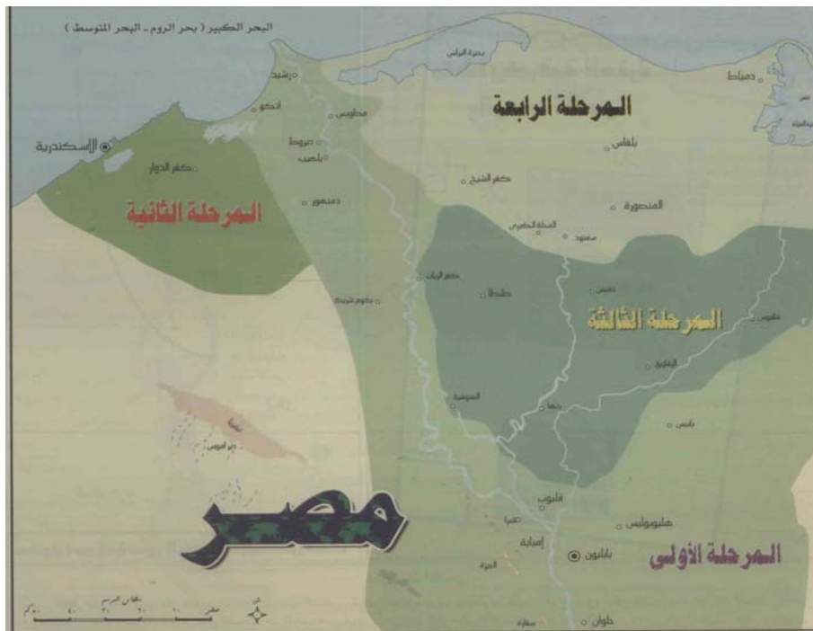
بلیس (دوره اسلامی)؛ واقع در مرحله نخست فتح (مغلوث، ۳۸۶).