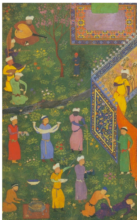
تصویر ۳) اجتماع نوازندگان (محل نگهداری: موزه کاخ گلستان)