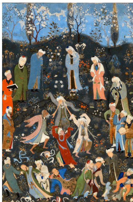
تصویر (۱) سماع دراویش (محل نگهداری: Metropolitan Museum of Art)