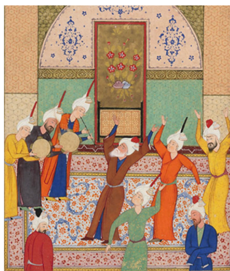
تصویر (۲) سماع دراویش (محل نگهداری: Bodleian Libraries University of Oxford)