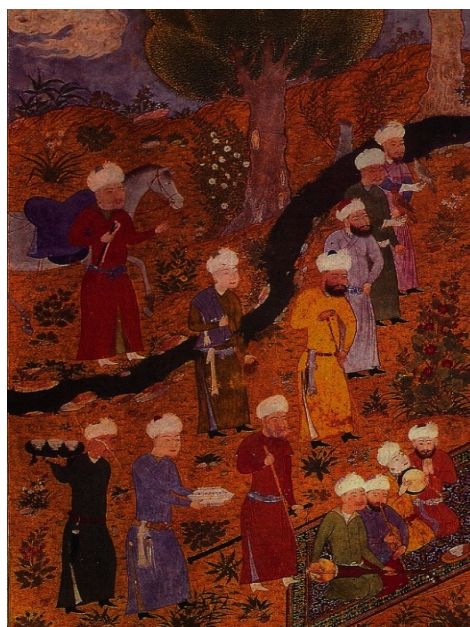
تصویر ۴) اجتماع نوازندگان (محل نگهداری: The British Library)