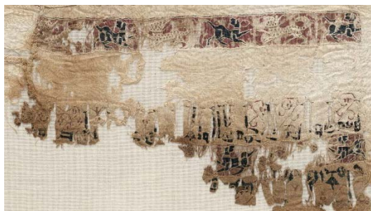
شکل ۳. طراز وصله شده به آستین از ابریشم و کتان، مربوط به دوره المستنصر در سده پنجم. (موزه

کلیولند، ۵۵۲.۱۹۵۰) https://www.clevelandart.org/art/1950.552