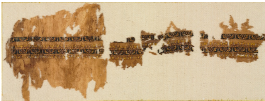
شکل ۱. طراز زردوزی شده مربوط به سده چهارم و پنجم که نام خلیفه الحاکم را دارد و شاید بخشی از آستین پهن بوده است (موزه کلیولند، ۱۹۵۰.۵۴۹). https://www.clevelandart.org/art/1950.549