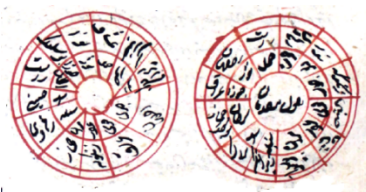
دوایر ترسیم شده در نسخه ۵۱۸۰

یکی دیگر از وجوه تمایز میان نسخه‌های این رساله در فصل «در آنچه پرده‌ها را به بروج نسبت کرده است» دیده می‌شود. در گونه اول این رساله دوایری برای نشان دادن نسبت پرده‌ها به بروج ترسیم شده براساس آرا متقدمین و متأخرین، که در سایر نسخه‌ها علی‌رغم اشاره در متن، این دوایر ترسیم نشده‌اند و شاید بتوان این شاهد را دلیلی بر اصالت بیشتر گونه اول دانست.