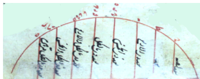
جدول ابعاد نسخه ۲۹۱۱ سپهسالار